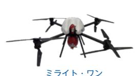
ミライト・ワン 水素容器運搬用 水素燃料電池ドローン