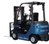
トヨタ L&F 燃料電池フォークリフト