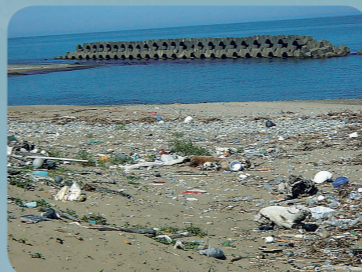
ひょうちやく かいがん いしかわけん ごみが漂着した海岸(石川県)