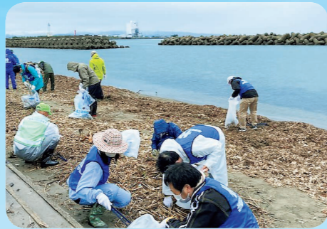
かがんせいそうかつどう 海岸清掃活動