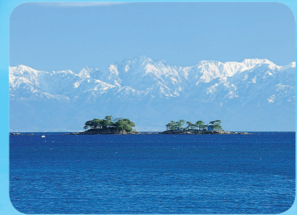
とやまけん うつ うみ 富山県の美しい海