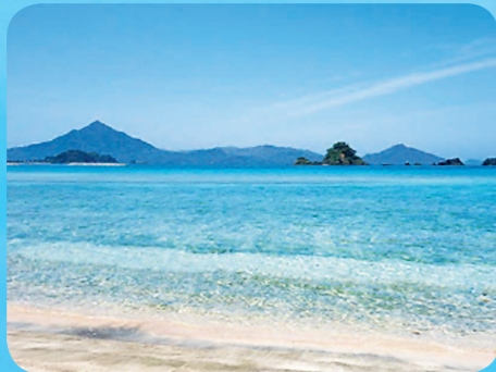
ふくいけん うつ うみ 福井県の美しい海