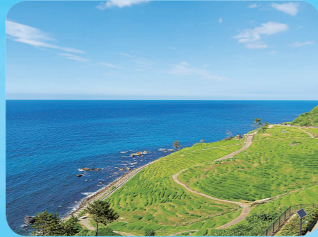
いしかわけん うつ うみ 石川県の美しい海