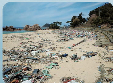
ひょうちやく かいがん ふくいけん ごみが漂着した海岸(福井県)