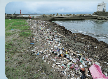
ひょうちやく かいがん とやまけん ごみが漂着した海岸(富山県)