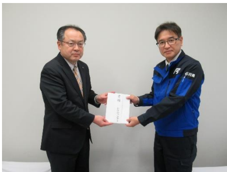
(石川県 中村出納室長へ東田専務理事より寄付)